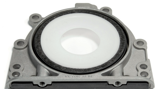
Ilustración 2_Lado inferior del retén integrado

VICTOR REINZ la forma óptima de adquirir una buena empaquetadura.